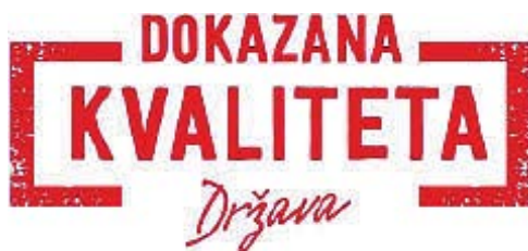
Slika 4. Oznaka „Dokazana kvaliteta“ s naznakom države, Izvor: Anon, 2020.

Nacionalni sustav „Dokazana kvaliteta“ uspostavljen je na način da troškovi certifi-