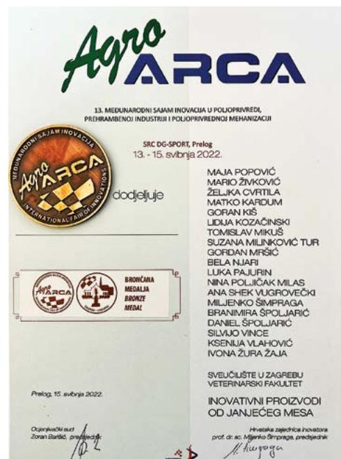
Slika 4. Priznanja dodijeljena za inovativnost HRZZ projektu na AGRO ARCI 2022. Figure 4 Awards for innovation awarded to the HRZZ project at AGRO ARCA 2022