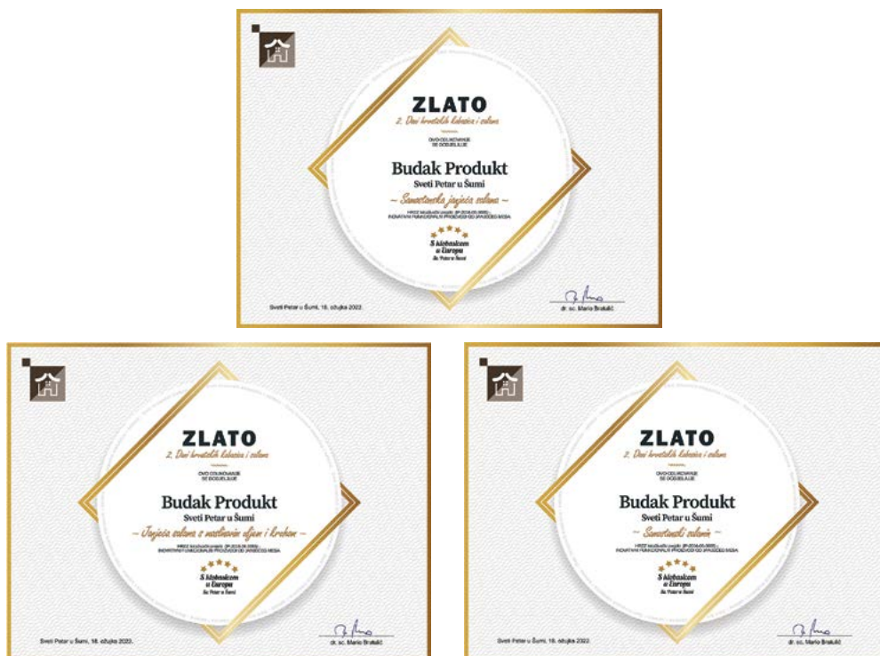
Slika 6. Priznanja dodijeljena za inovativnost proizvoda HRZZ projektu na 2.danu hrvatskih kobasica i salama u Sv. Petru u Šumi