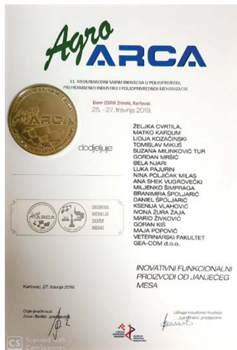
Slika 2. Priznanja dodijeljena za inovativnost HRZZ projektu na AGRO ARCI 2019. Figure 2 Awards for innovation awarded to the HRZZ project at AGRO ARCA 2019