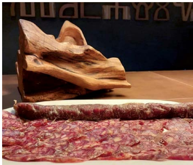
Slika 7. Salama od janjetine s maslinovim uljem Figure 7 Lamb salami with olive oil

2021.). Uvjerena smo da naša današnja inovacija, koja je prvenstveno rezultat znanja stečenog kroz proces istraživanja projekta, može predstavljati i instrument za povećanje konkurentnosti i pokretanje razvoja poduzeća te tako pridonijeti gospodarskom i društvenom boljitku neke zemlje. Na tragu naših promišljanja je i sama Hrvatska agencija za znanost koja je projekt IP-2016-06-3685 u svojem Godišnjem izvješću za 2021. godinu, kojeg su voditeljici dostavili početkom 2023. godine, uvrstila u poglavlje odabranih istraživačkih priča.