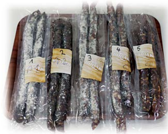
Slika 5. Proizvodi kojima je u okviru HRZZ projekta dodijeljeno priznanje za inovativnost na AGRO ARCI 2022.

Proizvedeni proizvodi s manjim udjelom kolesterola, povoljnim masnokiseliskim i aroma sastavom ocijenjeni su od strane domaćih i međunarodnih evaluatora senzoričke vrlo visokim ocjenama te nagrađeni u sklopu EU projekta „S KLOBASICOM U EU” (Slika 5-6).