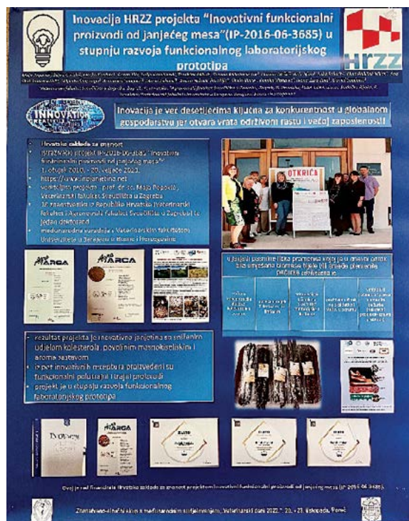
Slika 1. Prezentacija inovacije na Međunarodnom znanstveno–stručnom skupu “Veterinarski dani 2022” Figure 2 Presentation of the innovation at the International Scientific and Professional Meeting "Veterinary Days 2022"

S obzirom na dobro poznatu činjenicu da su inovacije prije svega rezultat rada talentiranih pojedinaca koji svojim radom stvaraju uvjete za veću efikasnost proizvodnje, nije ni bilo iznenađujuće kada je grupa znanstvenika temeljem svojih znanstveno-stručnih kompetencija nakon pet godina istraživanja prezentirala inovativni proizvod na Međunarodnom znanstveno – stručnom skupu “Veterinarski dani 2022” koji se je održao od 20. do 23. listopada 2022. godine u Poreču (Popović i sur., 2022.). Kako bi predmetna inovativnost bila dodatno prezentirana ovom prilikom prenosimo u cijelosti jedinstvenost inovacije istraživanja provedenih u